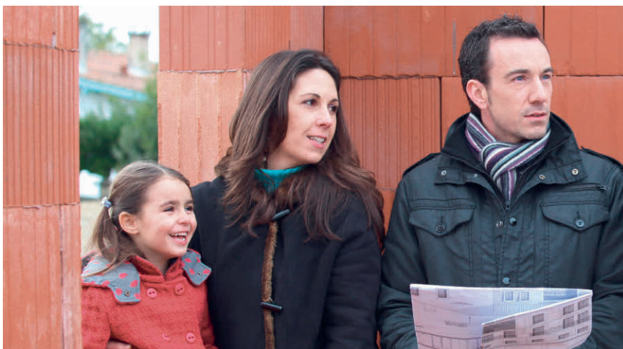
Fällt der Eigenmietwert oder nicht? Die Diskussion ist noch im Gang.

Steuerabzüge (Hypothekarzinsen, Unterhaltskosten u. a.) ebenfalls erhalten bleiben sollen. Im Nationalrat wurde rasch klar, dass der Ansatz, «den Fünfer und das Weggli» zu wollen, nicht mehrheitsfähig ist. Nun geht das Geschäft zurück an die Kommission. Mit raschen Änderungen in Sachen Eigenmietwert ist also vorderhand nicht zu rechnen. ■